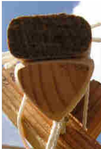
Jonction entre les perches de toit kirghize et le haut du mur