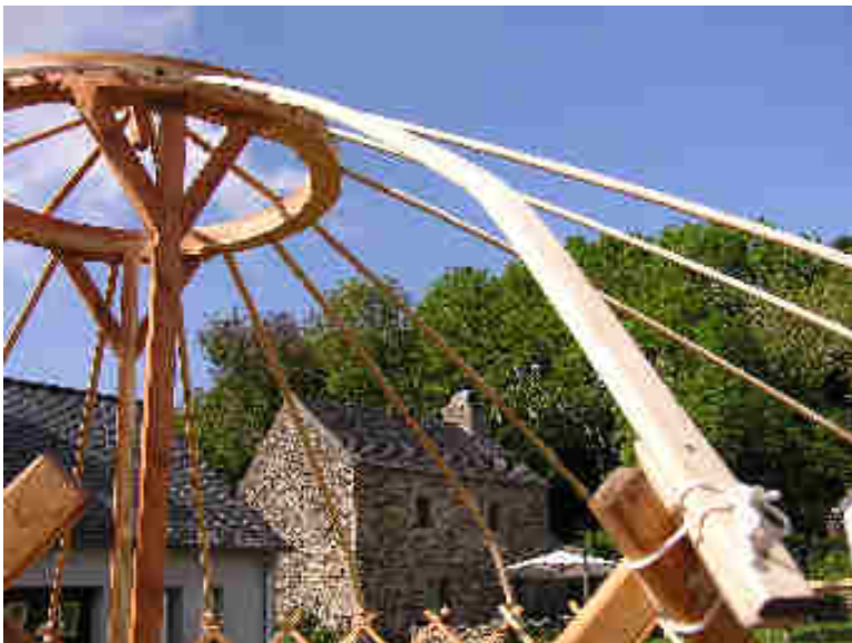
Montage d'une yourte kirghize