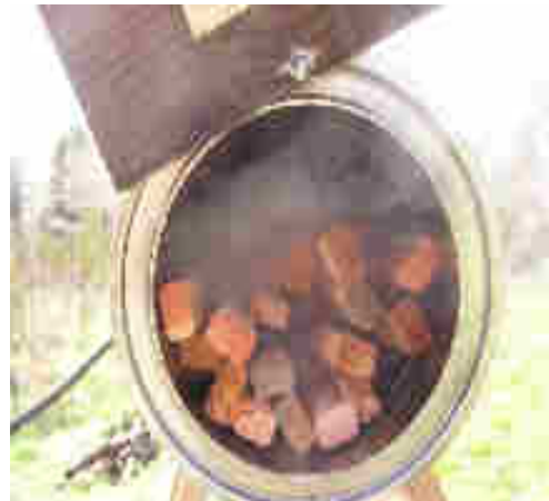
Perches dans le bain de vapeur