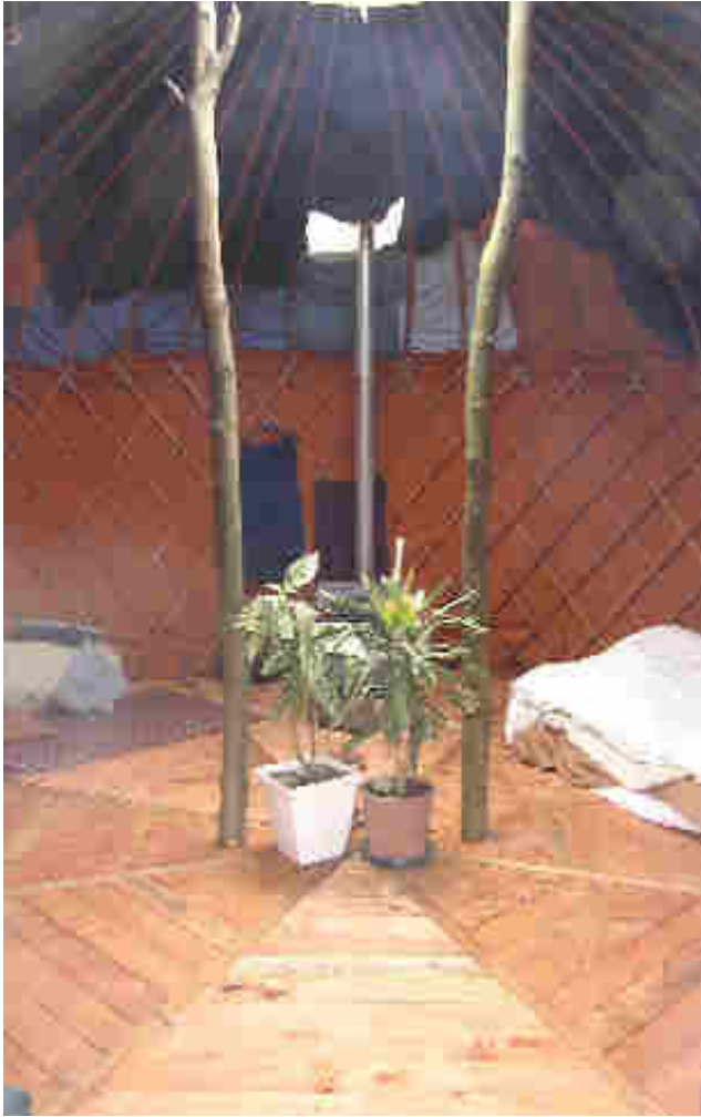
Yourte kirghize isolée en couverture militaire

D'autres types d'isolation sont possibles à moindre frais comme des couvertures militaires par exemple.