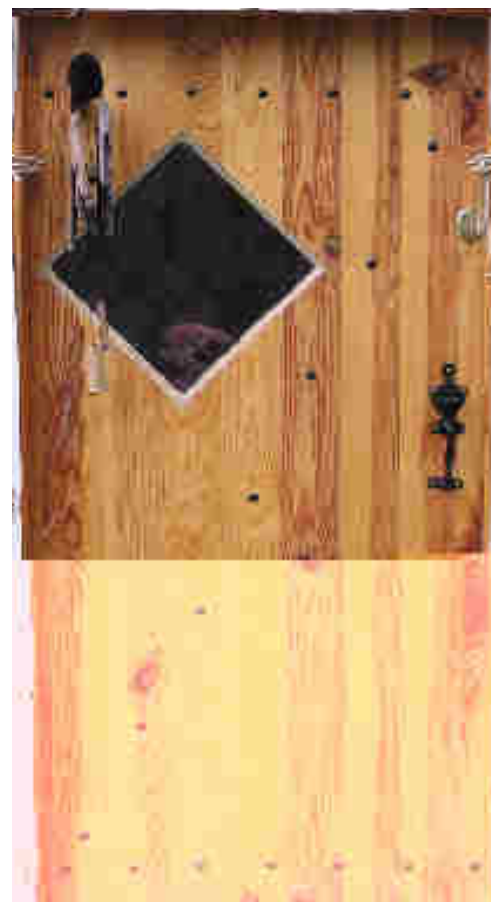
Porte vitrée en douglas, vue extérieure