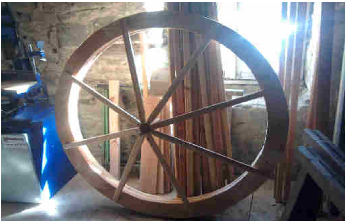
Couronne centrale en douglas

Le bois est ensuite travaillé dans l'atelier du Héron. Chaque pièce de la yourte est réalisée artisanalement puis assemblée par nos soins. Le bois ne subit aucun traitement chimique.