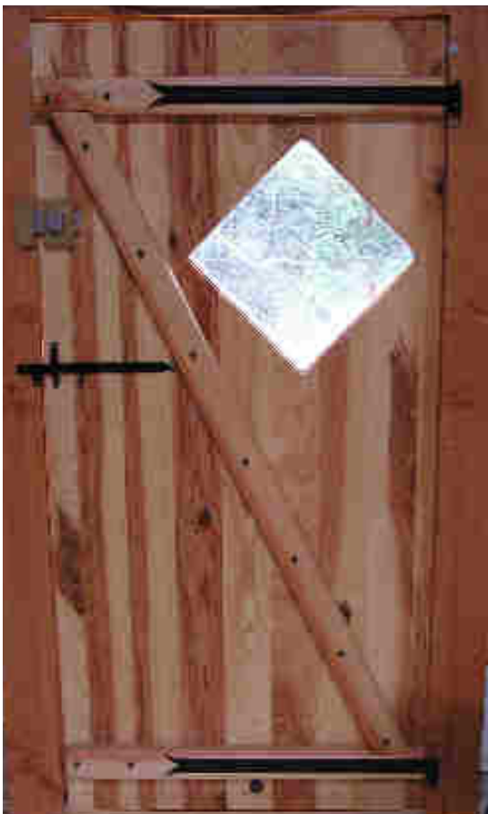
Porte vitrée en douglas, vue intérieure

Le nombre de portes est variable, ces portes peuvent aussi être vitrées.