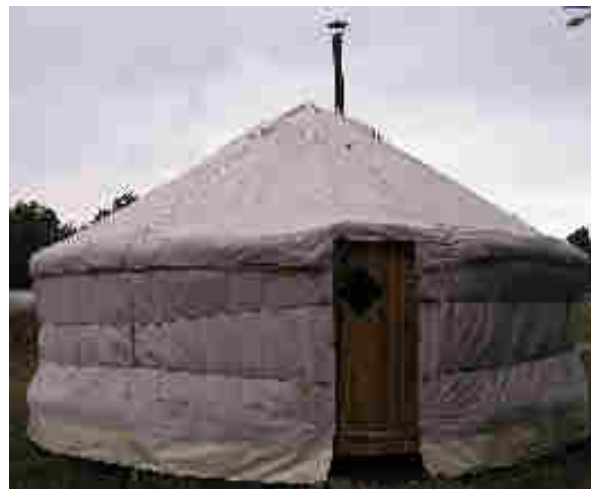
Yourte mongole et ses perches de toit droites

Nos yourtes sont équipées de toiles Nautiques qui ont une très bonne résistance aux champignons, aux moisissures et une excellente imperméabilité: