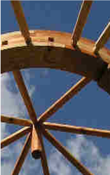
Couronne de yourte kirghize

Sur les yourtes kirghizes, les trous de la couronne accueillant les perches de toit sont carrés ainsi que l'extrémité des perches de toit qui s'y emboîtent. Cela évite que les perches de toit ne vrillent une fois montées. Une autre pièce triangulaire est fixée à l'autre extrémité de la perche de toit facilitant l'emboîtement sur le mur.