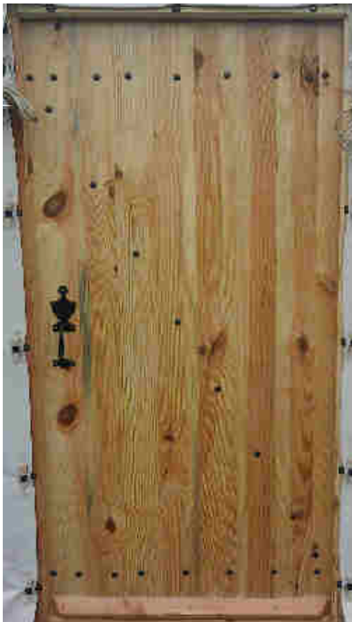
Porte pleine en douglas, vue extérieure