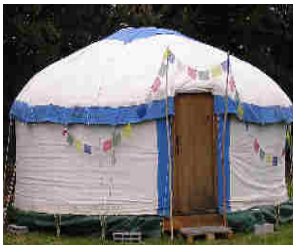
Yourte Kirghize et ses perches de toit courbées