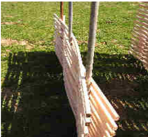
Perches de mur mises sous pression après le bain de vapeur