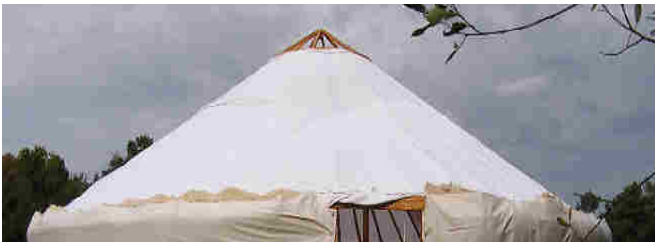
Pose de la toile de décoration intérieure sur le toit