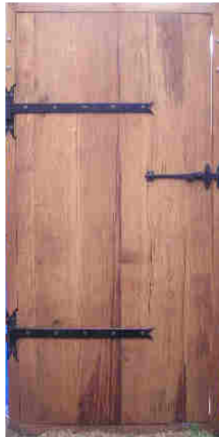
Porte pleine en chêne, vue intérieure

Une baie vitrée ouvrable ou non peut également être insérée dans la structure du mur.