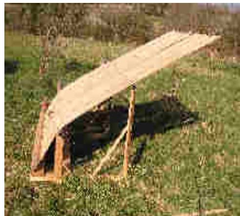
Perches de toit kirghizes mises sous pressions après le bain de vapeur