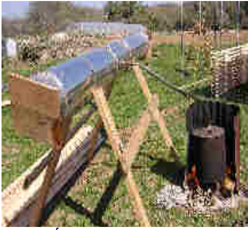
Étuveuse à vapeur

Les perches de toit de yourte kirghize et toutes les perches de mur (mongol et kirghize) subissent un étuvage afin de sécher le bois puis elles sont placées en pression afin de leur donner une légère courbe qui facilite le montage.