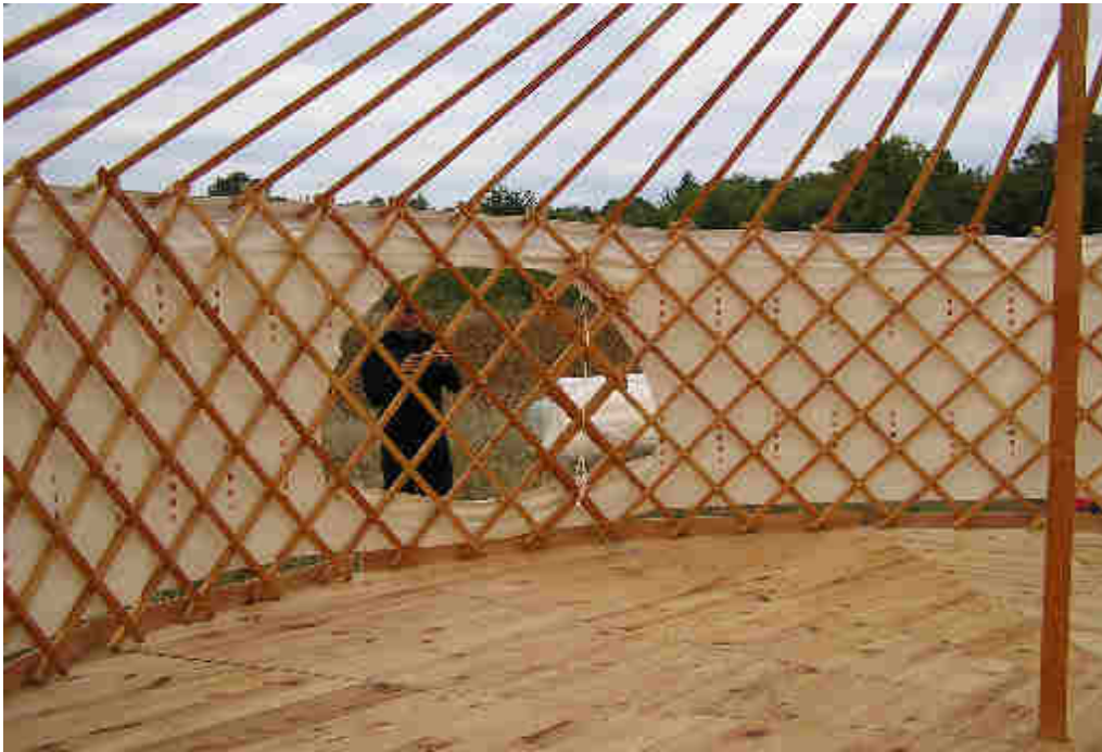
Pose de la toile de décoration intérieure avec emplacement pour la fenêtre

Si l'on opte pour une yourte avec isolation, il est préférable de mettre une toile de décoration intérieure. De couleur claire elle permettra de conserver une bonne luminosité. De plus, placée entre l'isolation et la structure elle protège de l'isolant.