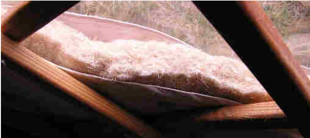
Isolation en laine de chanvre, épaisseur 4 cm

Les yourtes peuvent être pourvues ou non d'une isolation en feutre de chanvre, laine de chanvre.